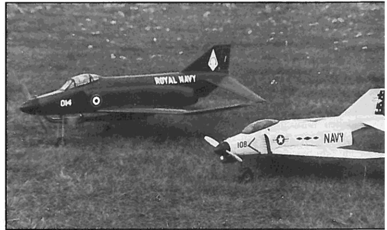
Klein und groß: Die Phantom, in zwei Größen nachgebaut

Modell insgesamt dreimal gebaut, einmal mit 800 mm und zweimal mit 1 000 mm Spannweite. Die kleinere Version fliegt mit einem 20er Motor etwas kribbelig, die größere Version aber, von einem 6,5-ccm-„Speed“-Motor angetrieben, liegt sehr ruhig in der Luft und läßt sich butterweich über alle Ruder steuern.